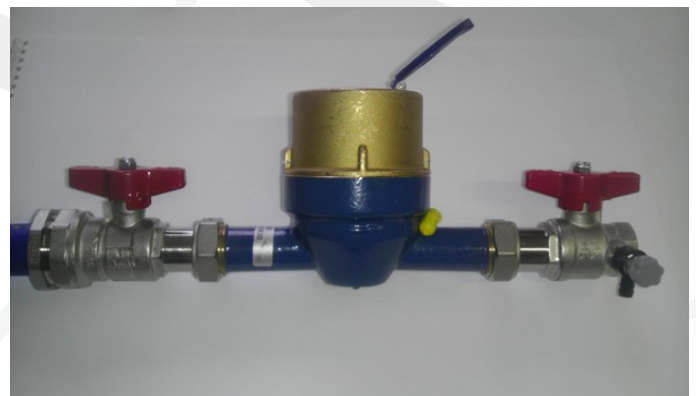
Obrázek 2 – Standardní vodoměrná sestava (směr toku vody zleva doprava)